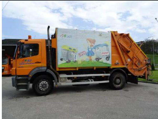
6 GM 030-LG Mercedes Atego-1322 4x2 Autosmečár 2006