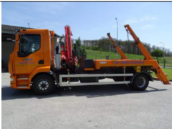
4 GM 026-LP IVECO AD260SY/PS Autosmečar 2017