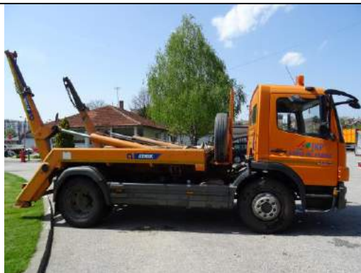
3 GM 022- XI Daf LF250 Autopodizač 2016