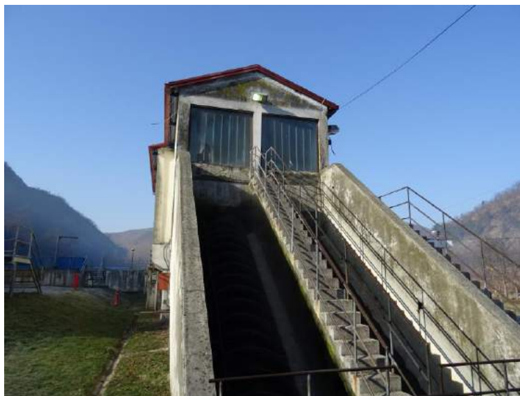
Пужне пумпе на улазу у постројење